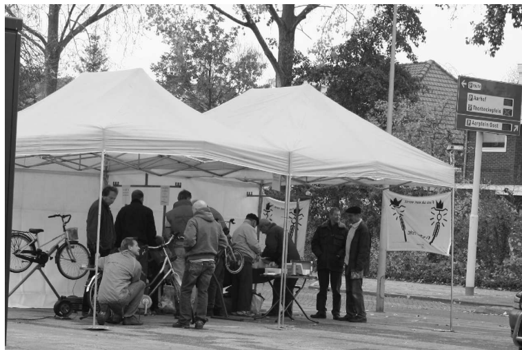
De stand aan De Vest

Op zaterdag 1 november 2008 hebben we in de regio de jaarlijkse fietsverlichtingsactie gehouden. Bij de stand aan De Vest (ingang Aarhof) in Alphen aan den Rijn was het weer een gezellige drukte. Ondanks het wat mindere weer (een graad of zeven, 's middags nog wat regen) konden we 90 klanten helpen. Dit was vergelijkbaar met andere jaren.