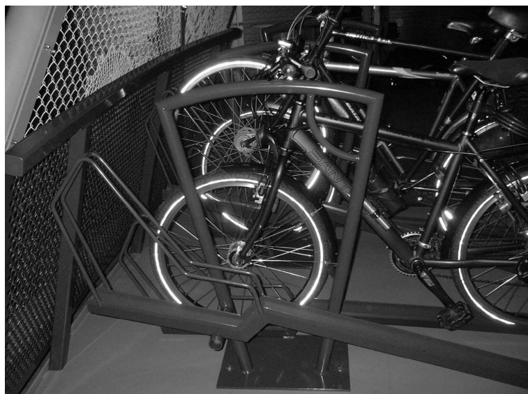
Het speciale rek met hekje in de proefopstelling van de Fietsappel

Helaas bleken de rekken nog verre van perfect. Een belangrijk probleem is dat fietsen niet echt vast in de rekken staan: een kleine aanraking is voldoende om de fiets een stukje naar achteren te laten rijden. Zelfs als de fiets op slot staat, kan dit voldoende zijn om de fiets half om te laten vallen. Een ander probleem is dat de hekjes die tussen de fietsen staan (en waar je je fiets aan vast kunt ketenen) te hoog zijn. Fietsen met een laag stuur lopen erop vast.