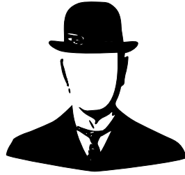
Figure 2: Voorbeeld van een plaatje dat ingevoegd is met het commando includegraphics

Het kan gebeuren dat er in het bewijs een berekening wordt gevraagd. Dan is het mooi dat \text{\LaTeX} speciaal gemaakt is om mooi en relatief simpel wiskundige notaties te gebruiken. Een en ander wordt duidelijk gemaakt in de volgende formule: